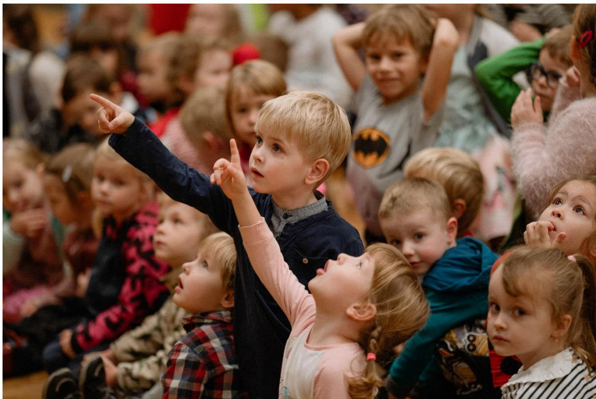
Obrázek 7 Edukační programy pro děti Filharmonie Brno Více hudby 108

Brněnské hudební edukační aktivity jsou otevřené všem milovníkům hudby. Cílovou a stěžejní skupinu nelze v tomto případě přesně definovat. Programy navštěvují posluchači od batolecích do sta let.