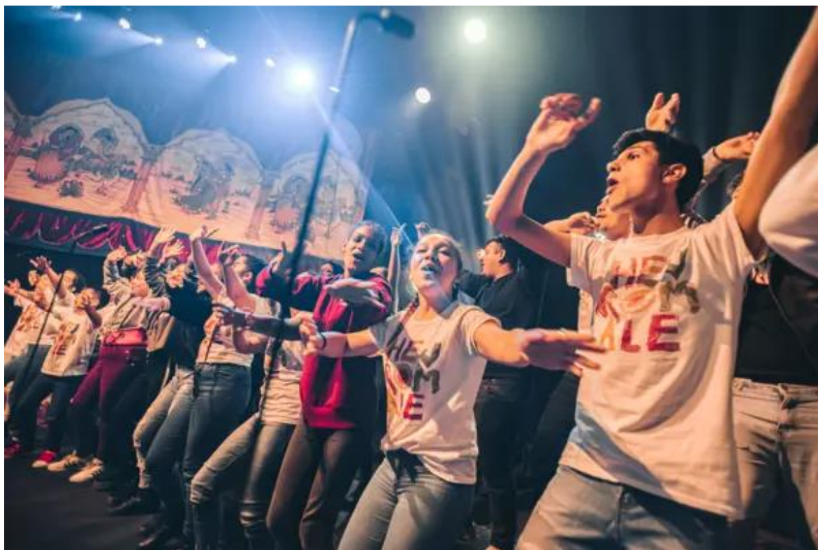
Obrázek 6 Hej Romale! 104

po celé republice. Setkání jsou otevřena učitelům z mateřských, základních, středních i základních uměleckých škol, kteří chtějí svůj zájem o hudbu a znalosti prohlubovat, a chtějí se v tomto směru dále rozvíjet a učit. 103 Jako poděkování pedagogům za jejich práci, byl v době covidu uskutečněn koncert A přece se učí!