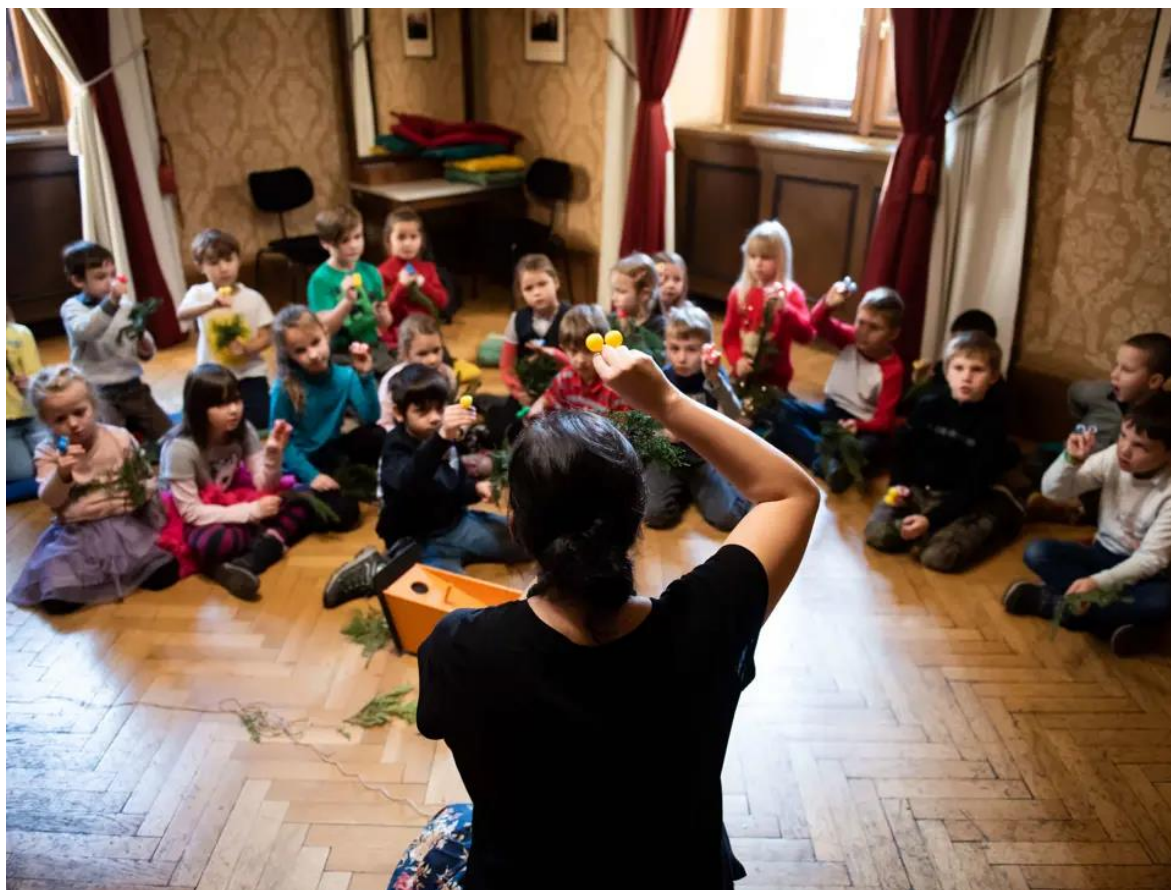
Obrázek 2 Fašánek aneb Rozpustilé lidové zvyky po celý rok 77

V letošní 128. sezoně jsme se mohli setkat s následujícími aktivitami, které lze ve výše vyobrazeném grafu snadno rozpoznat, pro jakou věkovou kategorii jsou určené. Pro ty nejmladší děti od 3 do 7 let je tu pravidelný program Rudolfínek . Hudební workshop je určen pro mateřské školy, po domluvě i pro děti v doprovodu rodičů, seznamující účastníky s muzikanty a jejich hudebními nástroji, celý doprovázený pohádkovým příběhem. Program zahrnuje několik workshopů, konajících se v průběhu celého roku: Pelíšek plný bicích , zaměřený na bicí nástroje a základy rytmizaci; Malé (nejen) hudební řádění , seznamující účastníky s prostory Rudolfiny; Bystrý lišák Leoš , workshop na téma Janáčkovy Lišky Bystroušky; Houslový zvěřinec ; Smyčcové mlsání , povídání se smyčci o smyčcích; Zvířátka a loupežníci v plechu , ve spolupráci se Sdružením hlubokých žesťů České filharmonie. 76