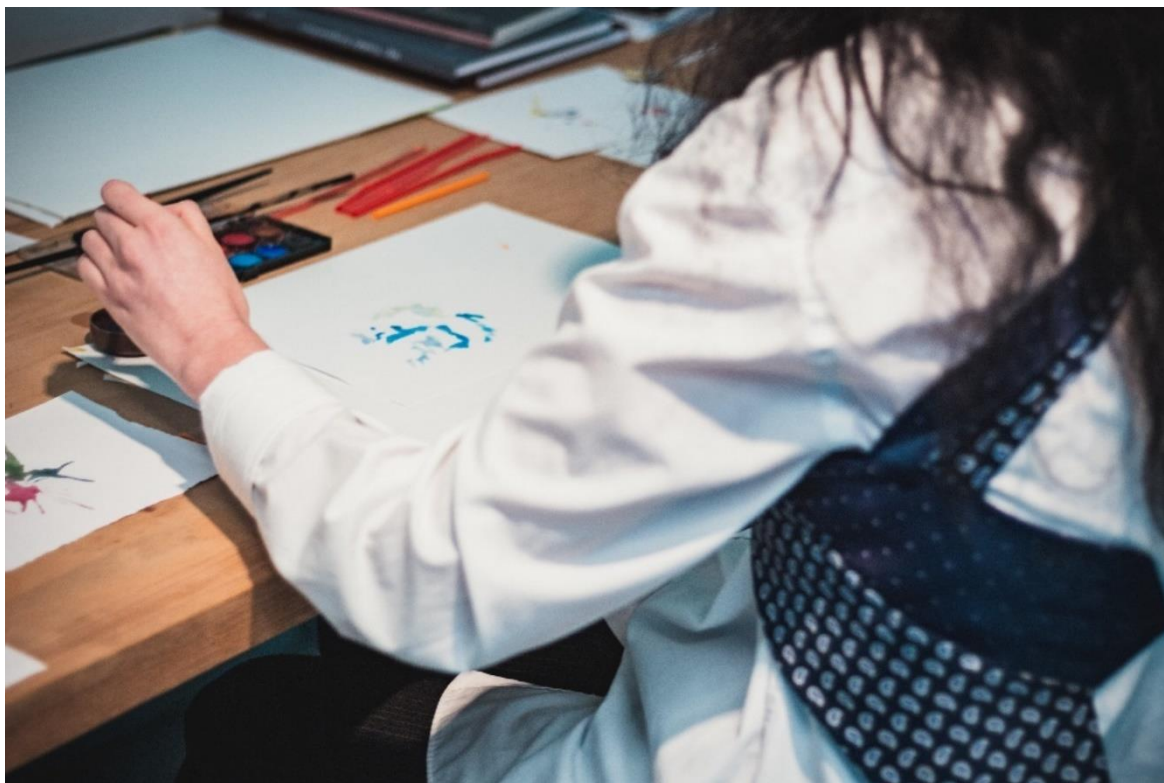
Obrázek 18 Vlastní hudebně-výtvarná dílna 145