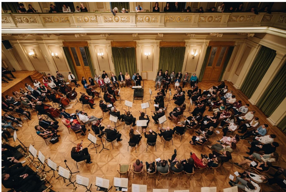
Obrázek 15 Projekt V orchestru 141