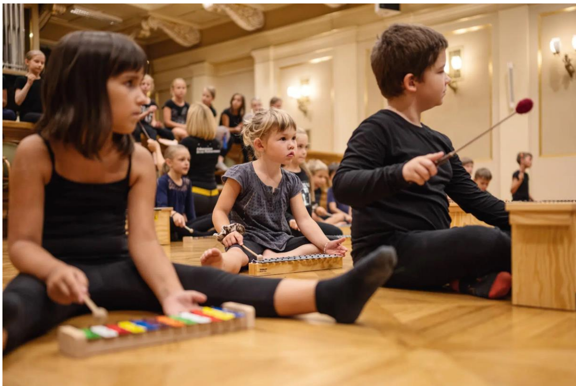
Obrázek 8 Orffohřiště 109

Pro mateřinky nabízí filharmonie hudební workshopy s jednoduchými tématy. Pojmy jako žabka, hlemýžď nebo kobylka jsou neobyčejná hudební zvířátka, doslova Houslová zvířátka . Orffohřiště pak seznamuje ty nejmenší hudebníky s nástroji orffovského instrumentáře a doplňuje hraní o veselé říkanky a písničky. Letošní rok přibyla na seznam nová dílna s titulem Ptačí cvrlikání , propojující ptačí svět se světem hudebních nástrojů, respektive zobcových fléten. 110