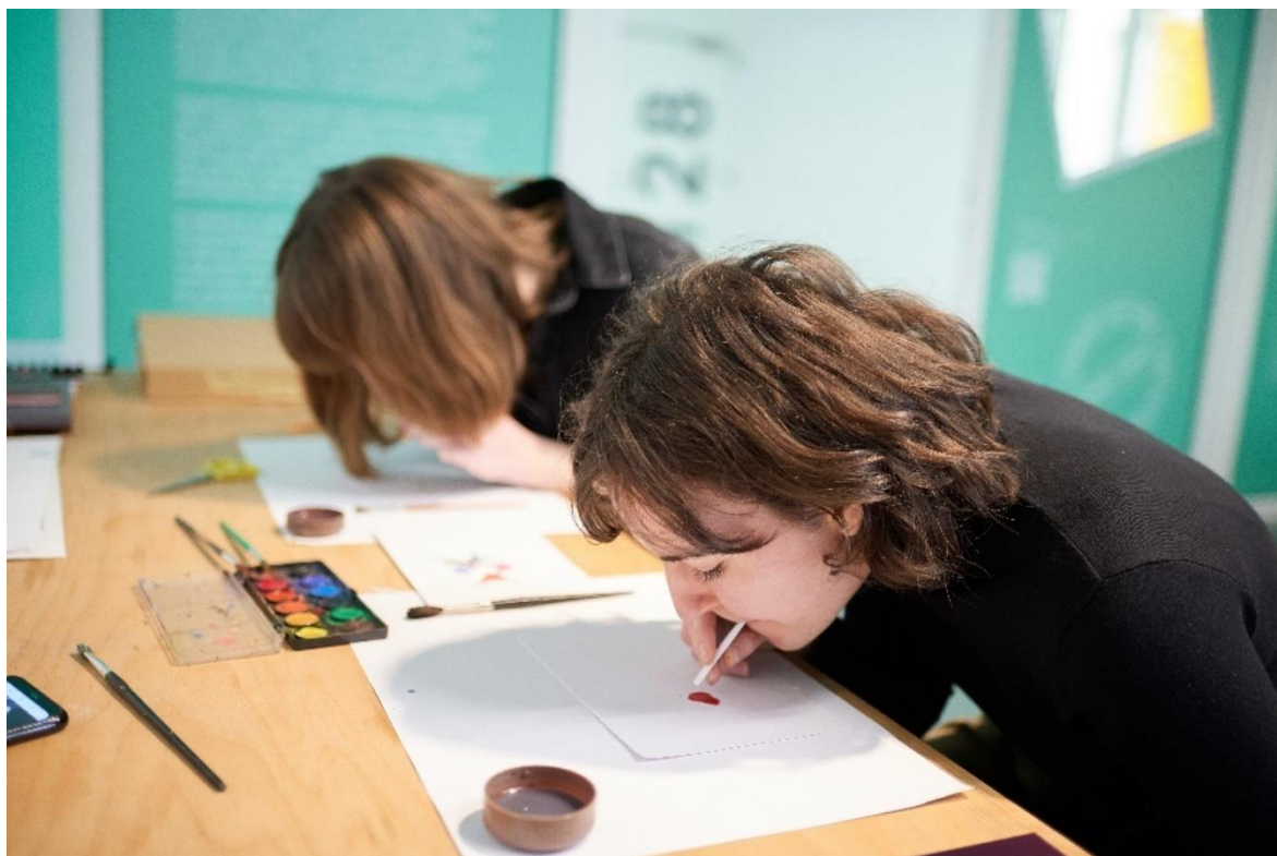
Obrázek 17 Vlastní hudebně-výtvarná dílna 144