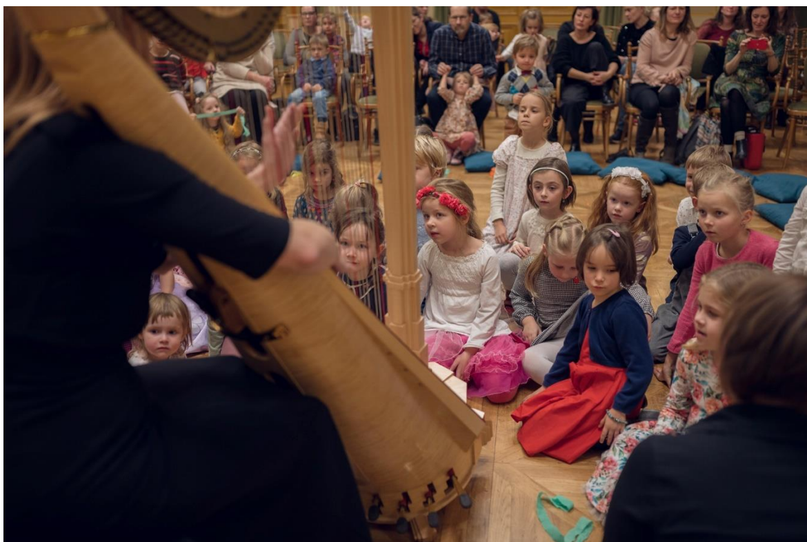
Obrázek 12 Komorní rodinná odpoledne 129

Před každým rodinným koncertem je pro děti připravena hudební dílna a pro rodiče beseda s dirigenty, hudebníky nebo dramaturgem.