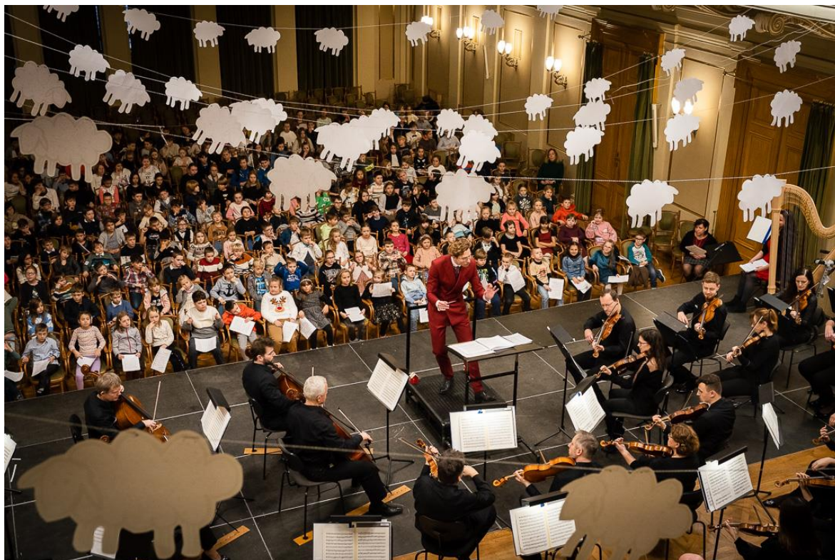
Obrázek 10 Hudba doby adventní 118

Různě tematicky laděné hudební workshopy, zaměřené na známé skladatele, filmové melodie nebo dokonce program na přání je schopna edukátorka dovézt i do vaší školy, pro děti na prvním i druhém stupni základní školy. 117