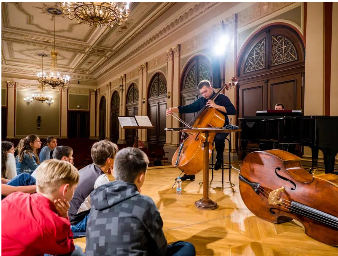
Obrázek 3 Dopoledne s filharmoniky 83

Skladatel Antonín Dvořák je v Rudolfinu jako doma a je mu věnována četná řada programů, které se věnují jeho skladbám i životním příběhům. Hudební dílna pojmenovaná Hluboký vesmír 84 , kde se děti, společně s lektory a s Dvořákovou symfonií Z Nového světa, vydávají do neprobádaných končin Galaxie. Netradičním způsobem si ve třech hudebních dílnách onu známou skladbu poslechnou, zazpívají i zahrají. Na další Dvořákovu hudbu se tančí i zpívá v programu Radosti i strasti pana Dvořáka , jenž je navíc doprovázen komiksovou knihou s ilustracemi ze skladatelova života. 85 Na kávu s Antonínem D. 86 mohou zajít středoškoláci. Lektorky zde chtějí přiblížit skladatelův život v roce 1896, kdy oddirigoval historicky první koncert České filharmonie, ale také jeho podporovatele a blízké přátele. 87 Dvořákulum je unikátní úniková hra v srdci Rudolfinu na motivy života Antonína Dvořáka, kde vám budou veškeré dveře této novorenesanční budovy otevřené. Cílem hry je nalézt části rukopisu symfonie z Nového světa. Nakonec hry symfonie zazní v podání