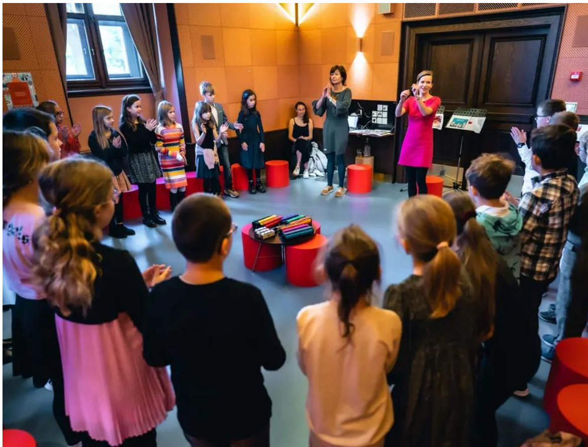
Obrázek 4 Radosti i strasti pana Dvořáka 90

filharmonického smyčcového kvinteta. 88 Projekt vznikl v době covidu, ve stejném roce, kdy se slavilo Dvořákovu sto osmdesáté výročí narození. 89