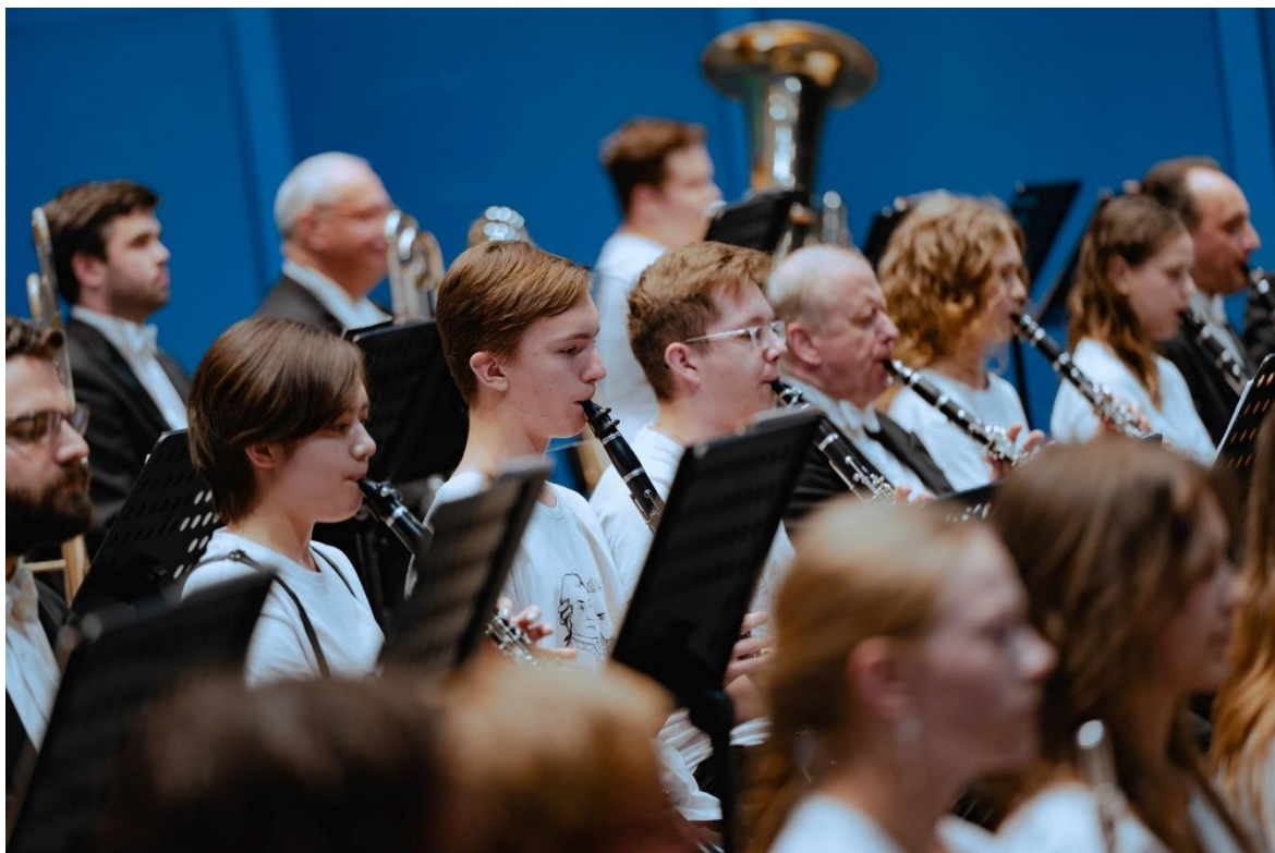
Obrázek 13 Mozartovy děti 133

Při Filharmonii Brno funguje, jako je tomu i u jiných hudebních těles, Orchestrální akademie 134 , vychovávající další generaci budoucích profesionálních hudebníků. Studenti a absolventi ze středních a vysokých hudebních škol získávají z působení v akademii cenné zkušenosti, které mohou prezentovat před diváky v rámci abonentní řady pojmenované Mladá krev aneb hudba zblízka . Koncerty akademiků jsou pojaty netradičním způsobem, rozestavěním míst po sále a blízkého kontaktu diváka s účinkujícími. V případě koncertování zajímavého profesionálního, českého i zahraničního hosta, otevírá Orchestrální akademie jednodenní Masterclass , kurz pro čtyři aktivní hráče a několik dalších neaktivních přihlížejících.