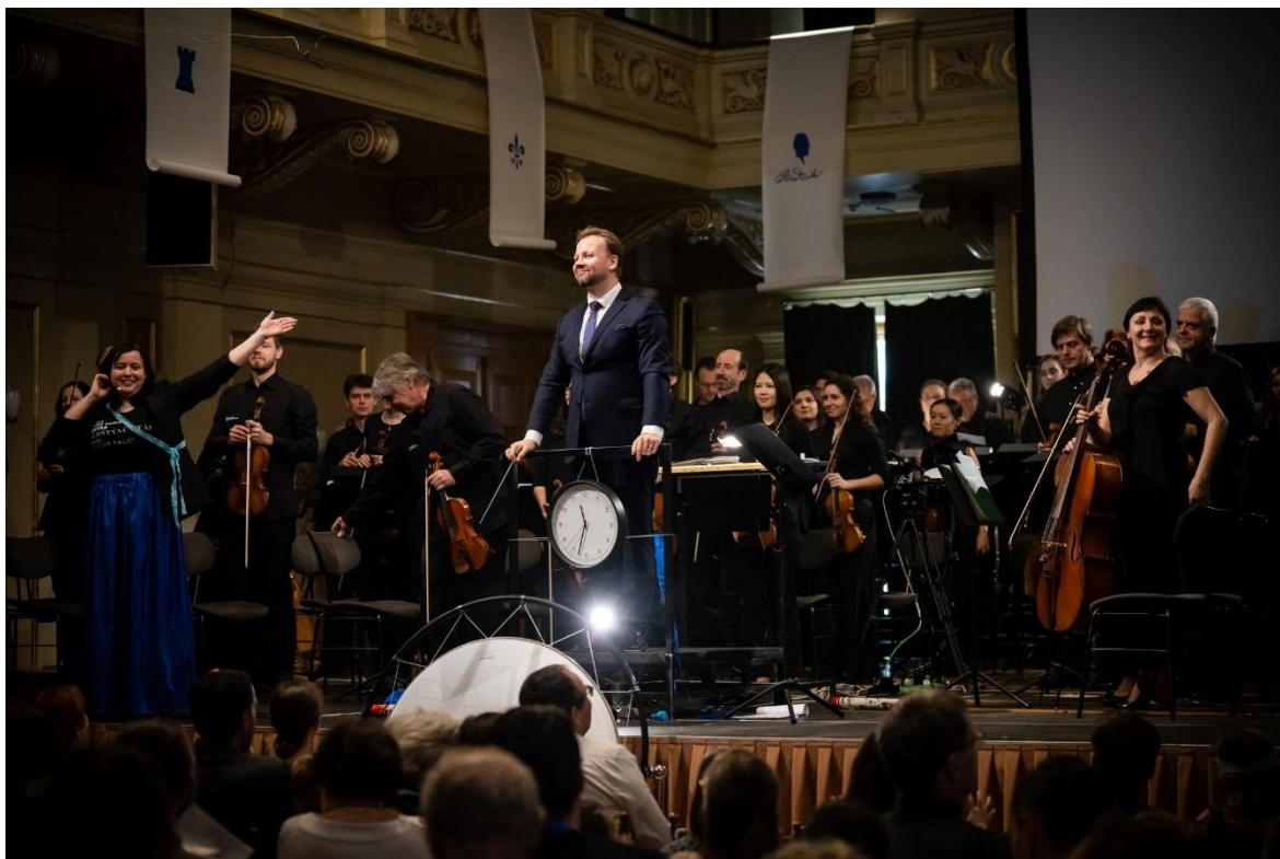
Obrázek 11 Hudba a jubileum 126

Názvy a program koncertů nejsou vycucané jen tak z prstu, jak by mohlo každé malé dítě říci. Jedná se o velmi důkladně promyšlený dramaturgický plán. Filharmonie Brno v loňském roce absolvovala koncertní turné po Americe. Než se však vydali na dalekou cestu Napříč Amerikou , zahrály americké skladby v Brně. Jejich velkolepý návrat pak mohli malí diváci spatřit na prknech Besedního domu, právě ve výše zmíněném 5. programu, Zase doma v Brně . Letošní rok, rok oslav 200 let od narození a 140 let od úmrtí Bedřicha Smetany 127 , v dramaturgickém plánu neminul ani Rodinné abonmá. Skladateli Bedřichu Smetanovi a jeho vrstevníkům, skladatelům, kteří byli jeho hudbou ovlivněni, byl věnován 3. abonentní koncert Hudba a jubileum .